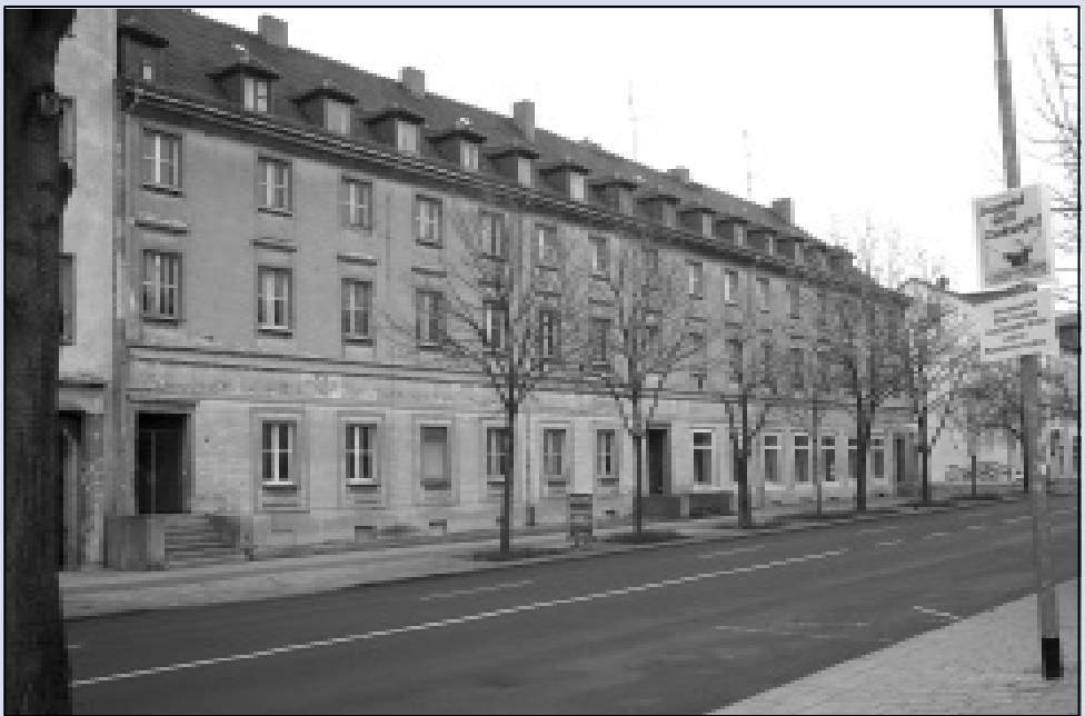
Die König-Heinrich-Straße 21-23: Noch sehr grau von außen, aber mit großem Hof. Aber bald werden hier die ersten Studierenden einziehen.

Insgesamt wird das Haus zukünftig etwa 60 Studierenden Platz bieten. Neben einer ansprechenden Herrichtung des gesamten Umfeldes, großen Wohnungen im ersten und zweiten Obergeschoss, wurden auch Maisonette- und kleinere Apartmentwohnungen für das Dachgeschoss geplant. Von großen Dachterrassen soll künftig ein weiterer Blick über die Stadt möglich sein. Zur Ausstattung aller Wohnungen gehören möblierte Zimmer, Einbauküchen und Laminatfußböden. Wie im Wohnheim sollen auch hier alle Nebenkosten im Preis enthalten sein. Im Erdgeschoss wird unter anderem – ganz studentisch – künftig ein Café mit Freisitzen im Garten das Königsviertel bereichern.