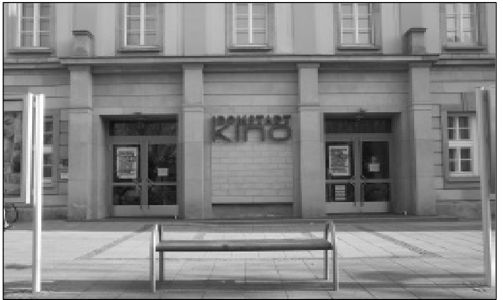
Das Domstadt-Kino in der König-Heinrich-Straße: Ort und wichtiges Thema des 5. Merseburger Kulturgesprächs