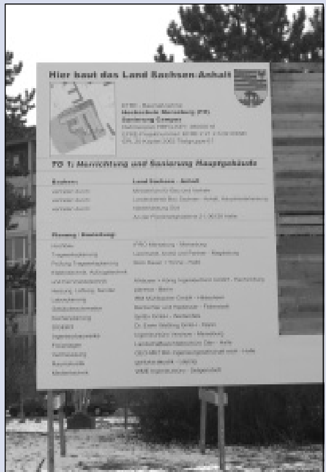
Hier baut das Land Sachsen-Anhalt: Noch fehlen die ausführenden Firmen auf dem Bauschild. Viele regionale Betriebe sollen den Zuschlag erhalten.

Das Schülerlabor "Chemie zum Anfassen" befindet sich in den Räumen 303 und 304 sowie 333 bis 335. Der Mac- sowie der PC-Pool sind in den Räumen 104 bis 107 untergekommen. Die Telefonnummern haben sich nach Auskunft des Dezernates für Liegenschaftsverwaltung und Technik in fast allen Fällen nicht verändert. Genaue Auskunft erteilen die Fachbereichssekretariate.